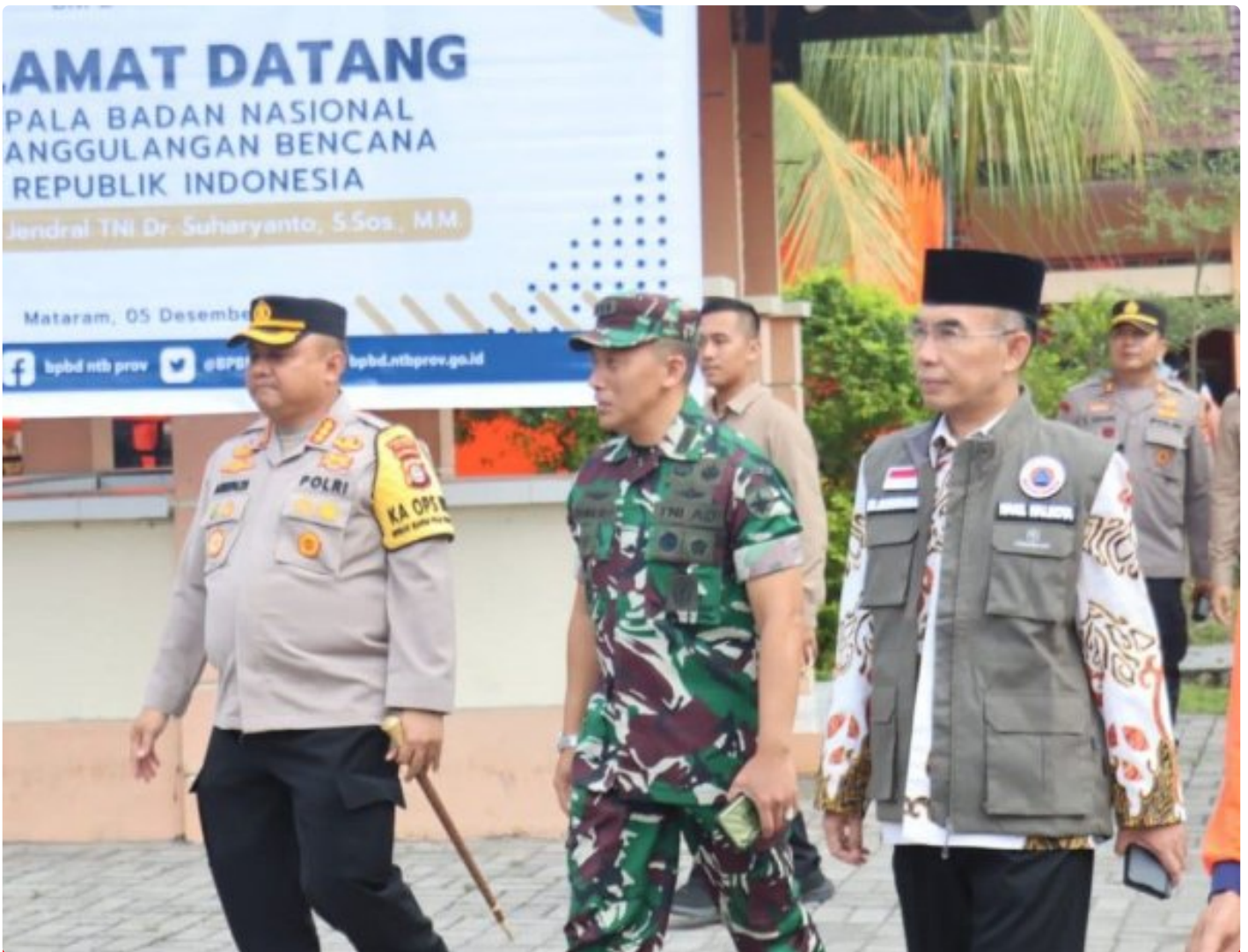
Kapolresta Mataram (Kiri) saat menghadiri acara Peletakan batu Pertama pembangunan gedung Pusdalops BPBD NTB, Kamis (05/12/2024)